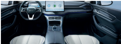
Black & Gray dual color

Rue Al Harir, Z.I Bir El Kassâa, 2059 - Ben Arous - Tunisie / Tél. : +216 36 038 000 / Fax : +216 36 010 099 www.byd.tn