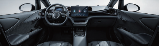
Noir et gris

Rue Al Harir, Z.I Bir El Kassâa, 2059 - Ben Arous - Tunisie / Tél. : +216 36 038 000 / Fax : +216 36 010 099 www.byd.tn